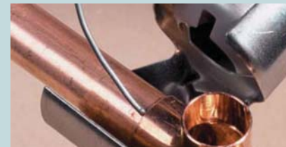
Пайка медных труб (только HG651C, HG551V)