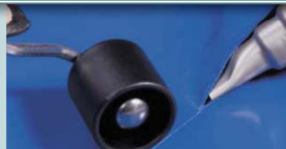
Спайка швов (только HG651C)