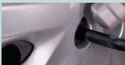
Ослабление затяжки винтов