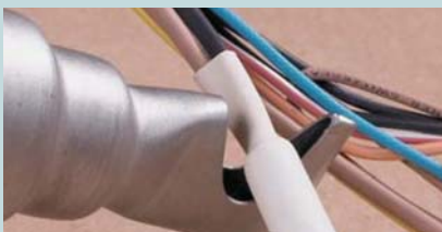
Монтаж термоусадочных трубок (только HG651C)