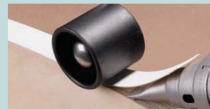
Приклеивание кромок (только HG651C)