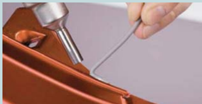
Пайка (только HG651C)