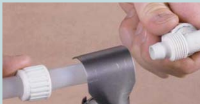
Монтаж пластиковых труб