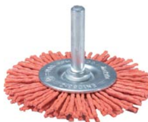
ЩЕТКИ ДИСКОВЫЕ предназначена для легких зачистных работ, придания шероховатости, удаления заусенцев, лака, шлака окалины, особенно при зачистке труднодоступных мест.