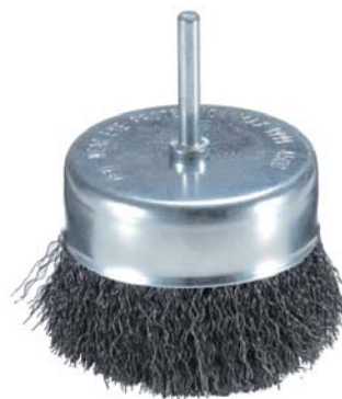
МЕТАЛЛИЧЕСКАЯ ЩЕТКА Стальная проволока толщиной 0,3 мм. Используется для очистки от краски, удаления ржавчины, загрязнений и пр.