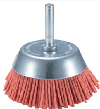
НЕЙЛОНОВАЯ ШЛИФОВАЛЬНАЯ ЩЕТКА Используется для очистки от краски, легкой ржавчины и пр.