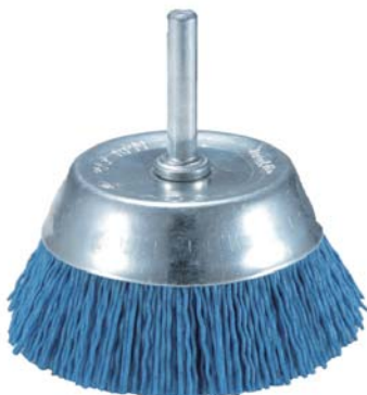
НЕЙЛОНОВАЯ ПОЛИРОВАЛЬНАЯ ЩЕТКА Используется для полировки металла, дерева, ПВХ.