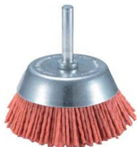
ЩЕТКИ ЧАШЕЧНЫЕ служат для подготовки поверхности к покраске, удаления ржавчины, старой краски, окалины, загрязнений, матовой отделки и искусственного старения древесины.